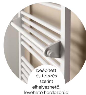
beépített és tetszés szerint elhelyezhető, levehető hordozórúd