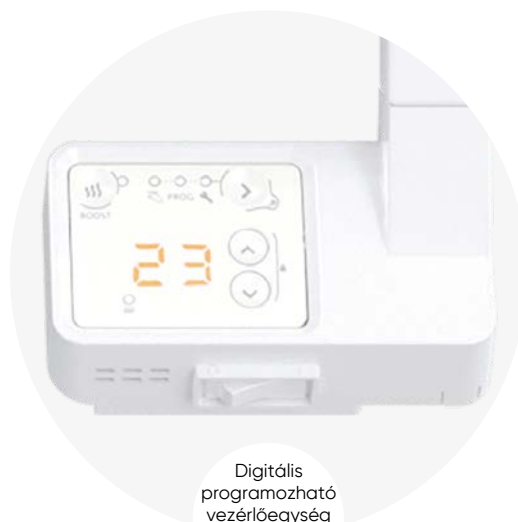
Digitális programozható vezérlőegység